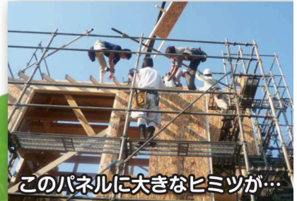
このパネルに大きなヒミツが...